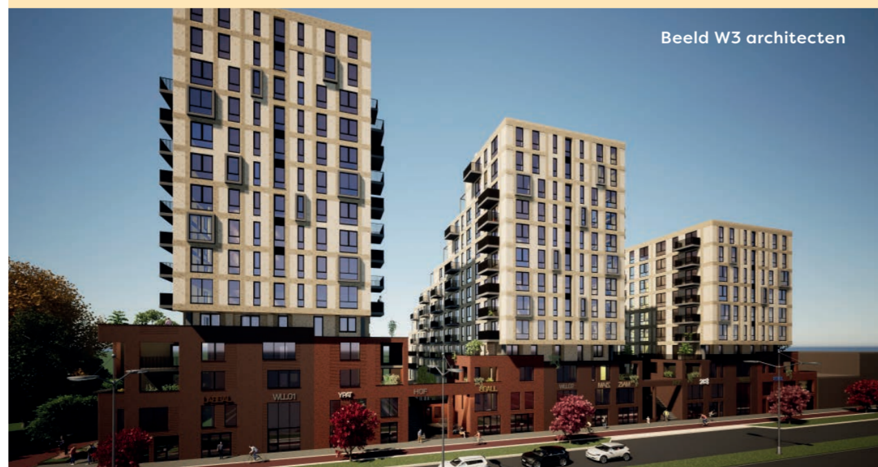
Beeld W3 architecten

Heeft u interesse in deze woningen? Dan is het belangrijk dat u ingeschreven staat bij Woonmatch Waterland.