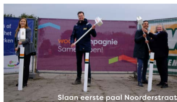
Slaan eerste paal Noorderstraat