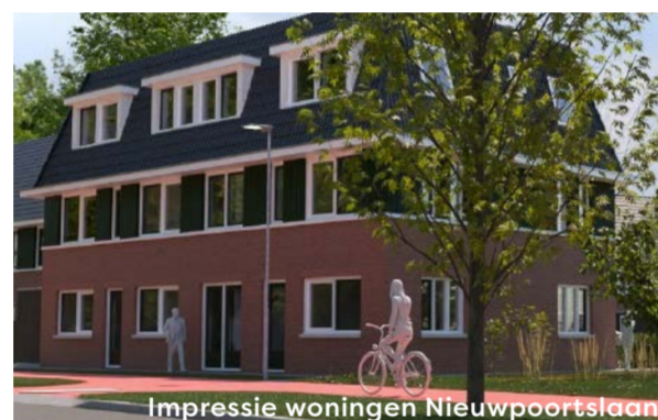
Impressie woningen Nieuwpoortslaan

Heeft u interesse in deze woningen? Dan is het belangrijk dat u ingeschreven staat bij Woonmatch Waterland.