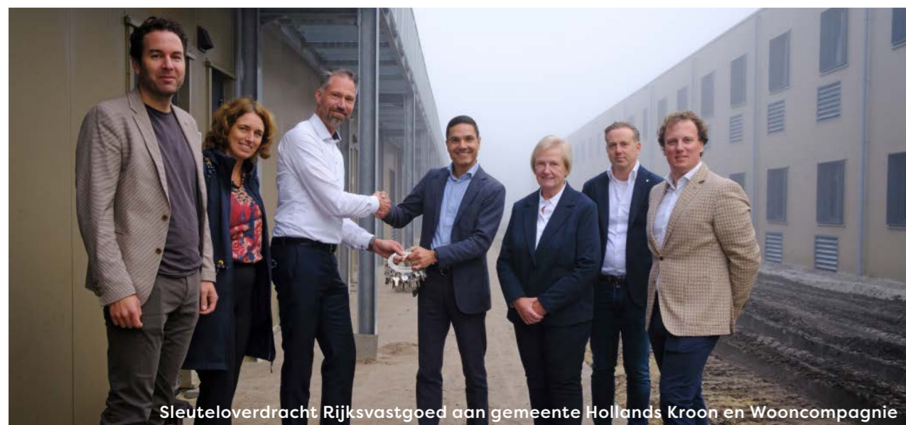
Sleuteloverdracht Rijksvastgoed aan gemeente Hollands Kroon en Wooncompagnie

De oplevering is gepland rond de zomer van 2025. De woningen worden ongeveer twee maanden vóór oplevering op Woonmatch geadverteerd. Om te kunnen reageren op deze woningen is het belangrijk dat u ingeschreven staat als woningzoekende bij Woonmatch Kop van Noord Holland.