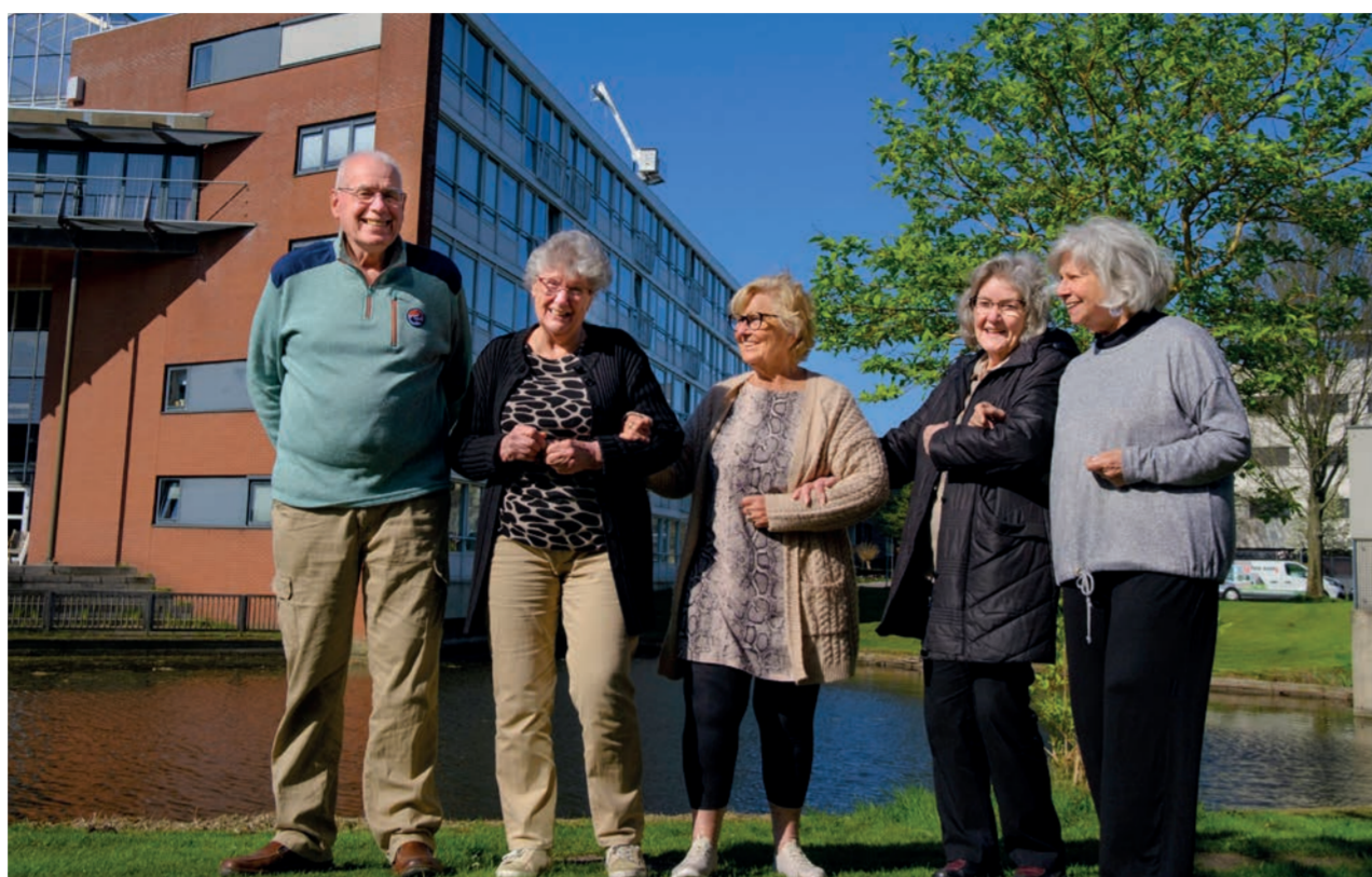
De bewonerscommissie Plataanstate