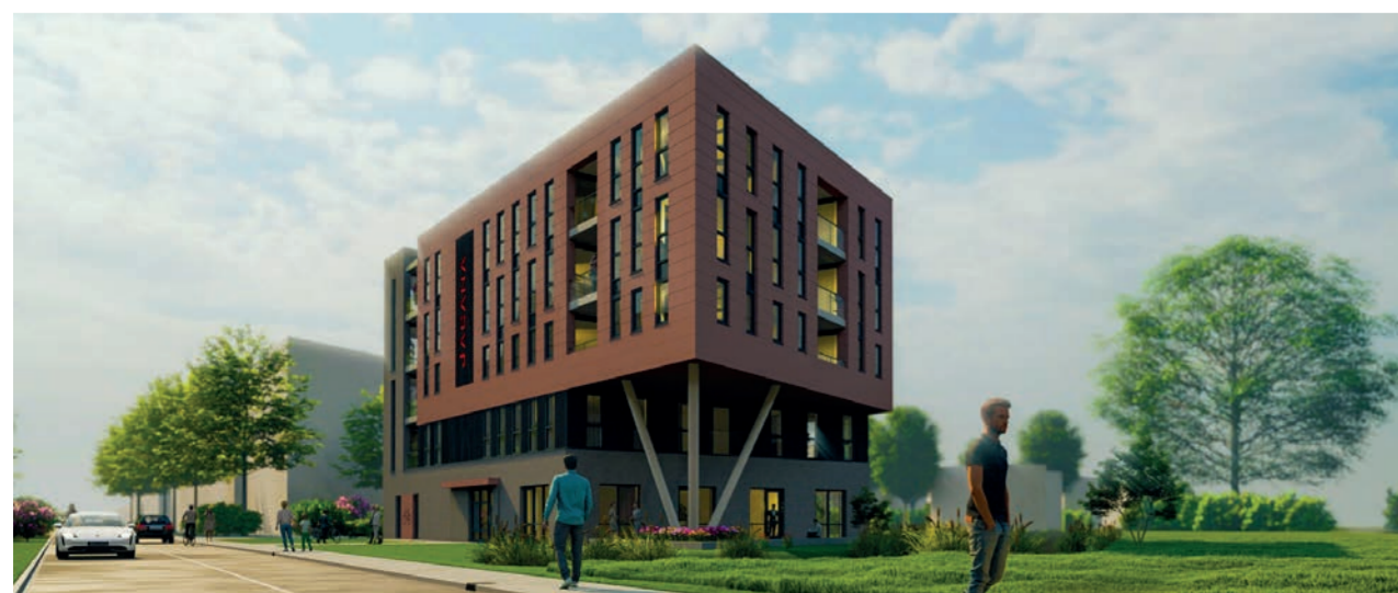
Nieuwe woningen Jacana aan de Wolgalaan

Ook bij het Waterlandkwartier, aan de rand van het centrum, wordt hard gewerkt. Het complex Terrazza bestaat uit drie appartementengebouwen. In één daarvan komen 84 sociale huurwoningen van Wooncompagnie. Onlangs werd hier het hoogste punt bereikt. De oplevering volgt begin 2026.