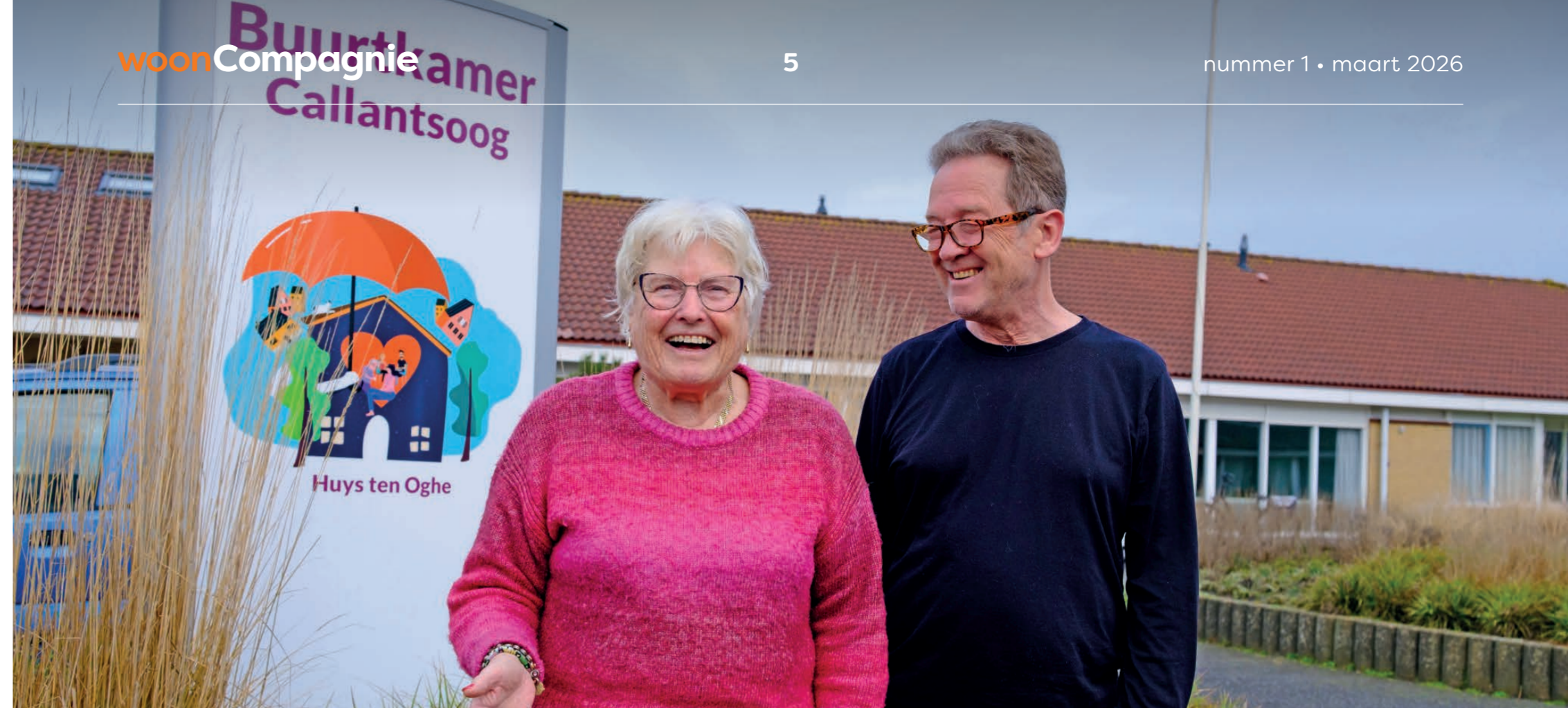
Bijbezoekers van de Buurtkamer

Samen genieten van gezelligheid en activiteiten